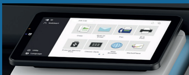
Nuovo pannello da 10,1" con feedback tattile