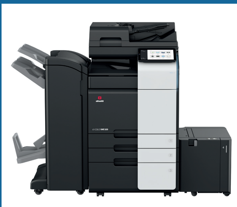
d-Color MF309 con DF-714+PC-416+LU-302+RU-513+FS-536SD